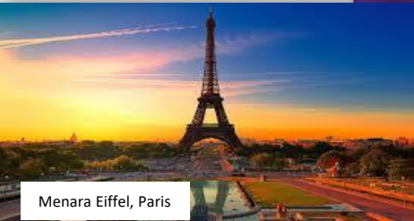
Menara Eiffel, Paris