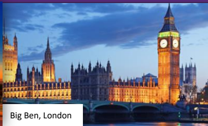
Big Ben, London